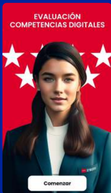
Ejemplo Asistente Virtual

Es entonces cuando se envía un correo electrónico a las cuentas proporcionadas por el cliente. Con el identificador de la cabina, el nivel obtenido y una copia de las respuestas. Todo el contenido se desarrollará en “Castellano” como único idioma